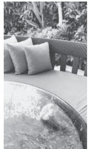
気が付けばところどころに落ちているプメリアの白い花。