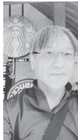
ウブドにはスタバがあった。

無事バロンダンスとレゴンダンスも見て、次の日はバナナやタピオカやヤシの実がなりプメリアの花が時折落ちてくるジャングルを歩きラフティングで川を下ってきた。様々なものを詰め込んだ二日間であった。