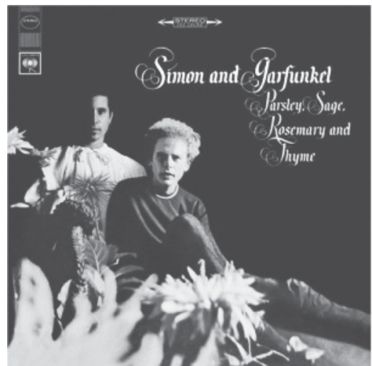
スカボロフェアー