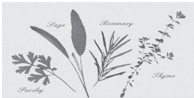
Tales of a Culinary Novice

"parsley, sage, rosemary and thyme"の繰り返し句は現代人にはよく理解できないが、象徴的意味に満ちている。パセリは今日まで消化の助けになり、苦味を消すと言われており、そして中世の医者はこちらを霊的な意味としても捉えた。セージは何千年もの耐久力の象徴として知られている。ローズマリーは貞節、愛、思い出を表し、現在でも英国や他のヨーロッパの国々では花嫁の髪にローズマリーの小枝を挿す慣習がある。タイムは度胸の象徴であり、歌が書かれた時代、騎士達は戦いに赴く際に楯にタイムの像を付けた。歌での話し手は、4種のハーブに言及することで、二人の間の苦味を取り除く温和さ、互いの隔たった