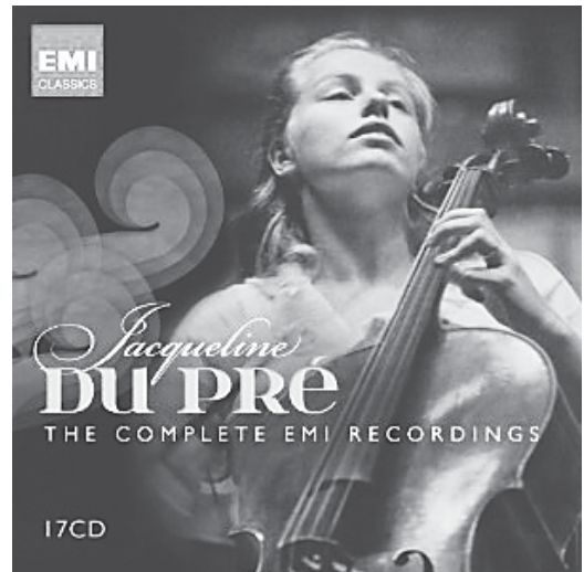
ジャクリーヌ・デュ・プレ

最近亡くなられたクラシック評論家の吉田秀和氏のエッセイ「之を楽しむ者に如かず」を読んだ。それにはデュ・プレについて次のように書かれていた。