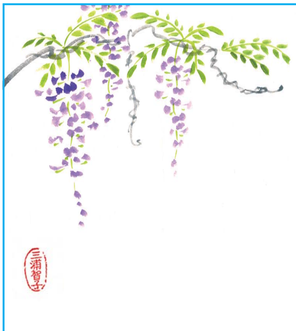
三浦 智子 画