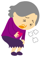
動悸・息切れがする